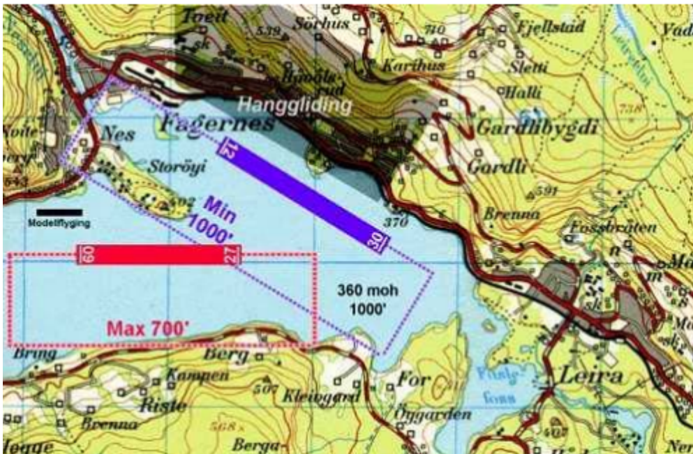
Kartutsnitt fra Nasjonale flykart, Avinor

Modellflystripen blir brøytet fra desember – tidlig januar for å oppnå gode isforhold til Flyklubbens årlige arrangement i medio mars hvor det kommer mange modellflygere fra hele Norge. Modellflystripen blir også brukt av lokale medlemmer i mindre skala, da for det meste i helgene. Veien ned på isen er sperret med stengsel og skilt blir hvert år satt opp for å forhindre unødig bruk av andre. Motorferdsel er i hovedsak for å opprettholde brøytet stripe med traktor og bil med brøyteskjær samt parkering for en del av brukerne av flystripa. Selve modellflystripen blir plassert med GPS koordinater hvert år for å være i god avstand fra nærliggende boliger og da dette området har vist seg å ha gode isforhold uten oppkommer eller elveutløp. Det har også blitt brøytet skøytebane i mange år på innsiden av modellflystripen i samarbeid med Fagernes Idrettslag. Plasseringen er også koordinert med flyklubben sin stripe for større fly og skiløpere som daglig går fra vestsida til Fagernes.