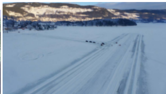
Bilde fra modellflystripa på Strøndafjorden

Valdres Modellflyklubb er organisert gjennom Norges Luftsportsforbund og Norges Idrettsforbund på lik linje med andre idrettsklubber.